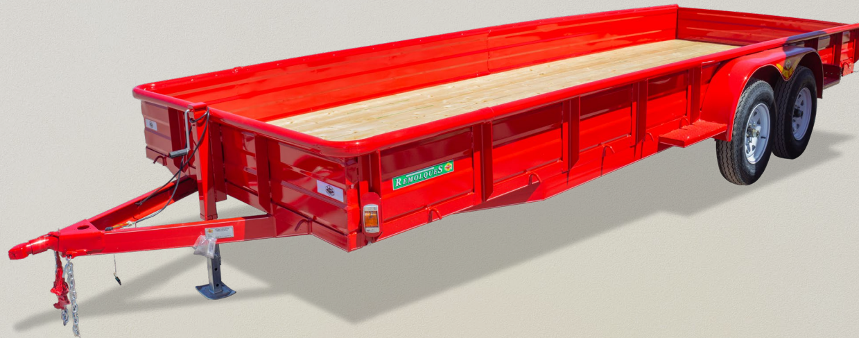
CAMA BAJA MODELO CB-7020 MC 3T